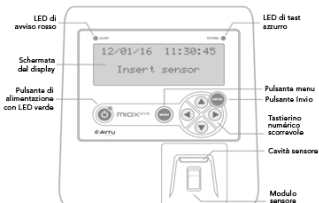
Figura 1. Analizzatore MIOXSYS